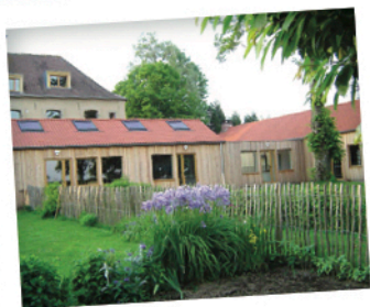
Eco-Gite adapté aux personnes en situation de Handicap