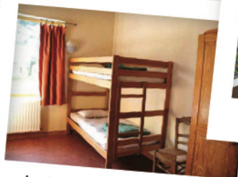
dortoirs + infirmerie