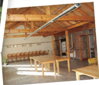
2 salles d'activités